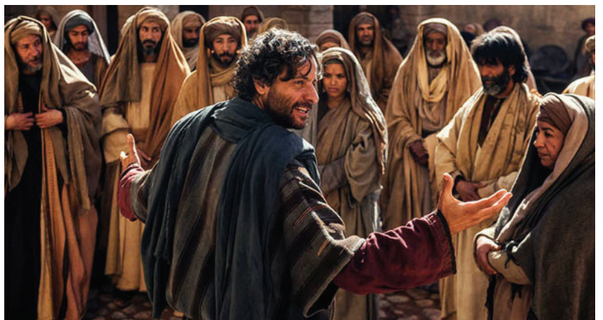
El sermón de Pedro en el templo – Hechos 2:14-36, Hechos 3:11-26

El libro de Hechos contiene 28 capítulos. Los primeros 12 dan cuenta de los sucesos que acontecieron a partir del último encuentro de Jesús con sus discípulos hasta el inicio del trabajo de Pablo como misionero cristiano. Los 16 capítulos restantes describen las actividades de Pablo, comenzando con su misión en la iglesia de Antioquía y finalizando con un relato sobre su residencia en Roma como prisionero del gobierno romano.